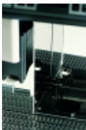
Evacuation directe du marc Coffee grounds direct chute discharge