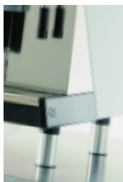
Pieds hauts Raised feet