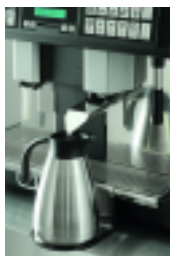
Service hôtel/déjeuner Hotel/breakfast service system