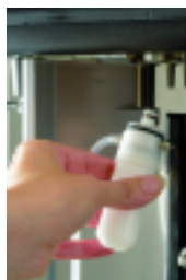
2 ème système cappuccinatore 2 nd cappuccinator device