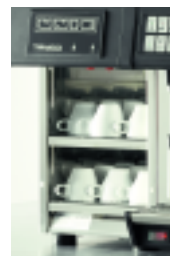
Module Chauffe-tasses Cup Warmer Module

Pour une performance inégalée, et dans une parfaite harmonie, la TANGO® DUO peut être combinée à la TANGO® SOLO, ainsi qu'aux différents modules.