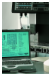
Connexion informatique Computer interface