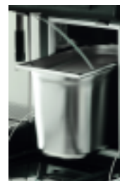
Module Cappuccino Cappuccino Module