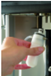
Système cappuccinatore Cappuccinatore device