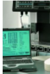
Connexion informatique Computer interface