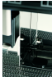
Evacuation directe du marc Coffee grounds direct chute discharge