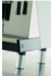
Pieds hauts Raised feet