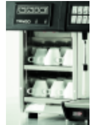
Module Chauffe-tasses Cup Warmer Module