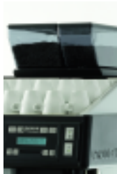
Deuxième moulin Second grinder