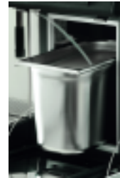
Module Cappuccino Cappuccino Module