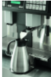
Service hôtel/déjeuner Hotel/breakfast service system